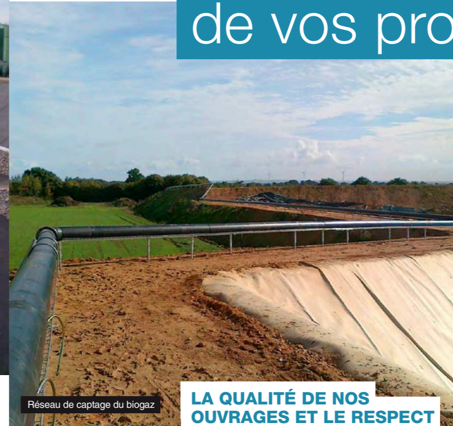
Réseau de captage du biogaz

Nous sommes présents à la création, la réhabilitation et la maintenance des centres d'enfouissement technique au niveau de l'étanchéité globale de l'ouvrage : • Aide à la phase de terrassement • Etanchéité active des casiers • Systèmes de drainage des lixiviats sur dispositif d'étanchéité • Réalisation des bassins de traitement • Couverture et réhabilitation • Puits et réseaux de dégazage en PEHD