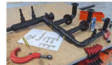
Atelier de chaudronnerie

La qualité est au cœur de nos préoccupations. Nous réalisons en amont toutes les opérations de mise au point nécessaires pour répondre à vos besoins et, avant toute expédition de pièce, un contrôle de conformité est réalisé.