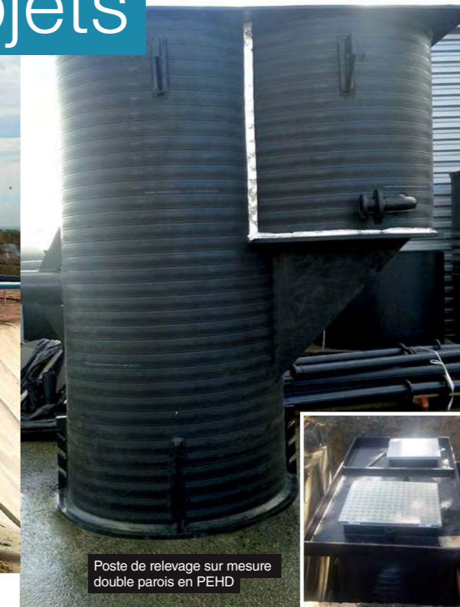
Poste de relevage sur mesure double parois en PEHD

Nous réalisons également tout type de bassins de stockage : • Stockage d'hydrocarbures et de matériaux polluants • Alvéoles de stockage temporaires • Plateforme de stockage de déchets (compost, mâchefer, etc.). Egouture de plateforme de stockage... • Bassins de traitement d'effluents industriels • Etanchéité sous dallage bâtiment • Etc.