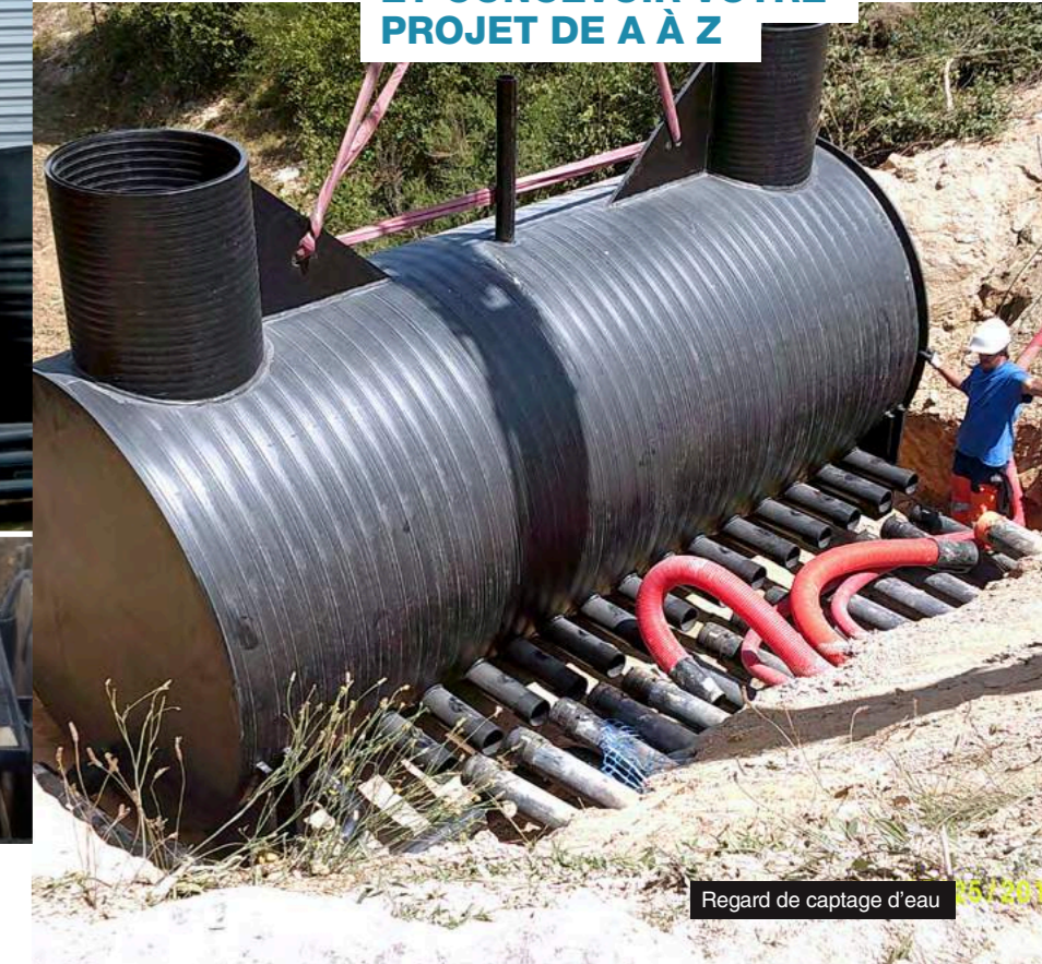
Regard de captage d'eau

NOS ÉQUIPES À VOTRE SERVICE POUR ÉTUDIER ET CONCEVOIR VOTRE PROJET DE A À Z