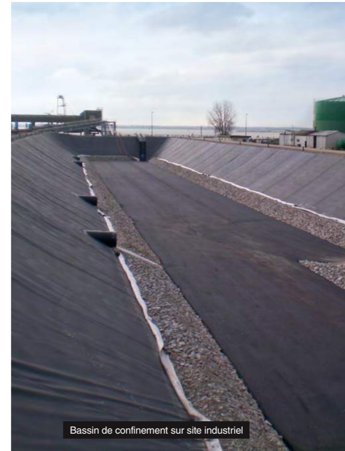
Bassin de confinement sur site industriel

COLLABORATEURS pour répondre à vos demandes. Sodaf Géo Industrie est le spécialiste de la conception, la fabrication et la mise en œuvre de systèmes performants à l'aide des matières plastiques.