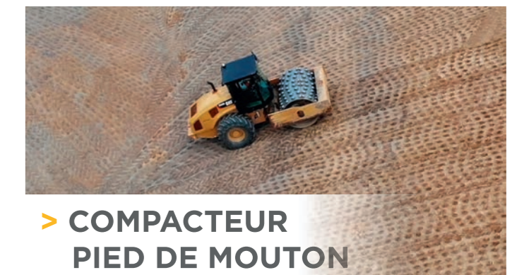
> COMPACTEUR PIED DE MOUTON