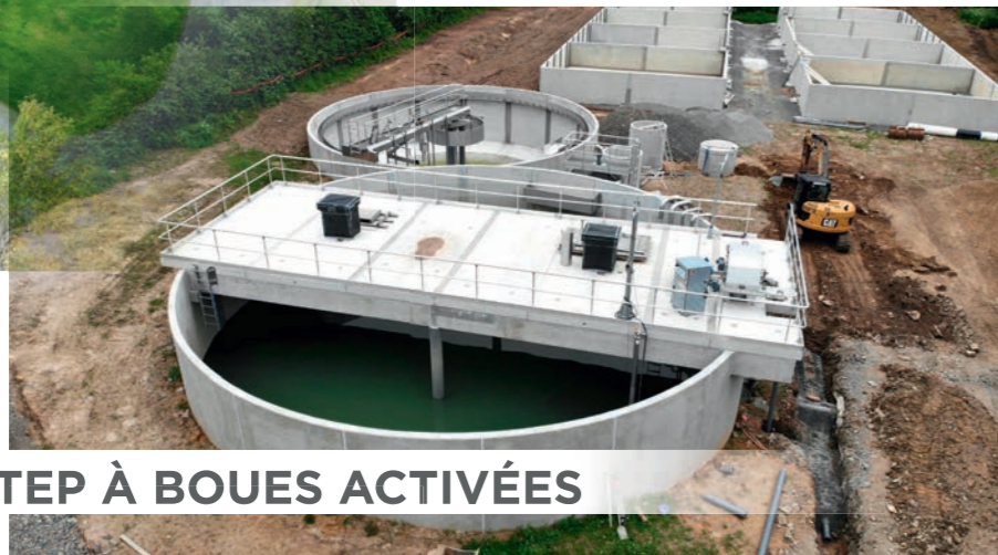
> STEP À BOUES ACTIVÉES